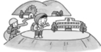
避難所、避難路の確認