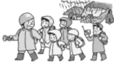
声を掛け合って早めの避難