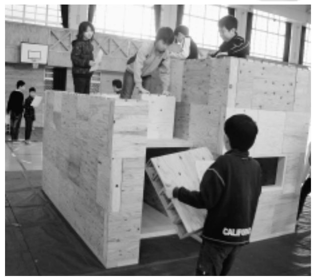
協力して簡易式組立式寢室の組立てを行う児童たち

町では、宝くじ助成金を利用した、平成22年度自主防災組織育成（地域防災スクール）助成事業により三成小学校と横田小学校に、組立式簡易型寢室、トランシーバー、ウエストホンなど防災備品13点を整備しました。3月には、防災学習の一環として、両小学校体育館を避難所と想定し、組立式簡易型寢室の組立てを行いました。組立ては、児童のみで行われ、児童たちの防災意識が養われました。