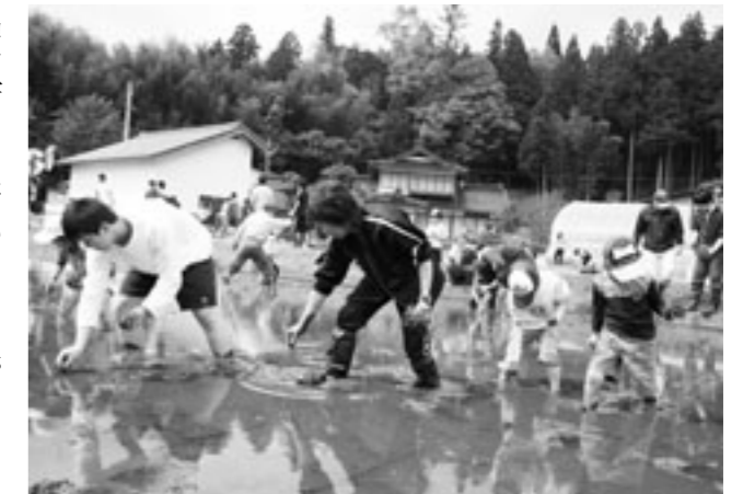
▲素足になって苗を植える学生と児童たち

島根りハビリテリション学院の一年生五十九人と高尾小学校の全校児童十六人が五月十四日、高尾地内の水田で手植えによる田植え体験をしました。