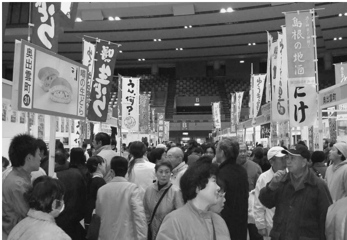
▲多くの人で賑わうふるさとフェア

鳥根県の魅力を広島でPRする鳥根ふるさとフェア2007が一月二十、二十一日、広島県立総合体育館で開催されました。 今年十周年の感謝祭として企画され、県内二十一日町村の特産品を並べる「しまねまるごと特産市」、観光情報を提供する「旅たびしまねゾーン」、屋外で各地域の味が楽しめる「しまねあつあつ屋台村」、「しまねフードスタジアム」など多彩な催しが行われました。 奥出雲町のブースには特産品の舞茸、エリンギ、餅、和菓子、地酒等が出品され、終日多くの方が訪れ商品を買いました。 また会場内で伝統の技を披露するしまね伝統工芸実演・