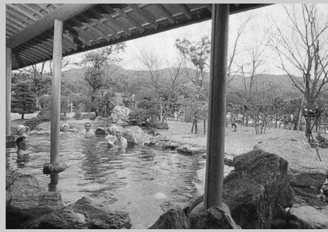
◀奥出雲の閑静な田舎風景に癒しを求めて常連急増中