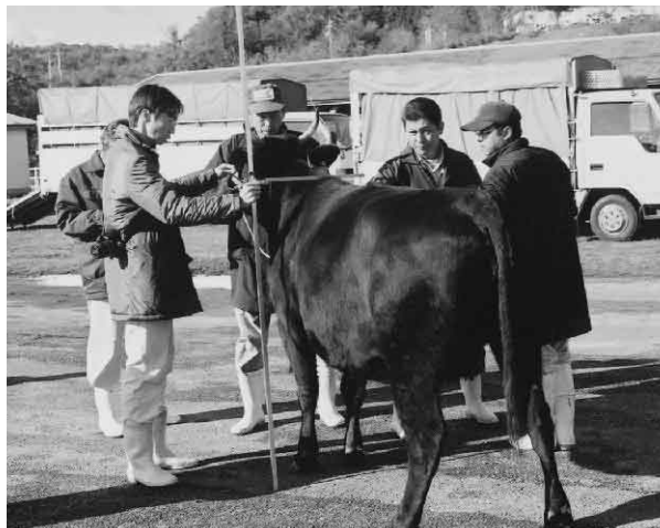
▶ 集合選抜会の様子

今後も候補牛の選抜を繰返し関係機関による巡回指導等を行いながら、来年3月の県集合審査に向け、飼養管理に努め第5区「繁殖雌牛群」の県代表の座を獲得できる様、町を挙げて取り組んでいきます。