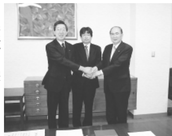
三者でがっちり握手

(株)仁多産業では、縫製後のジーンズに「形態安定加工」、「レーザ加工」など独自の技術を施し、高付加価値ジーンズとして全国はもとより海外でも商品展開しています。この技術が高く評価され年々受注量が増加していることから、生産体制を強化することになり九月五日、県庁にお