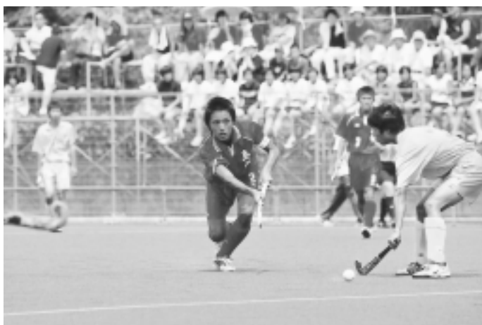
活躍する島根県チーム（少年男子）

十月に岡山県で開催される第六十回国民体育大会の出場権を賭けたホッケー競技の中国ブロック大会が、今年奥出雲町を会場に八月十九日から二十一日にかけて開催されました。