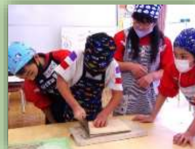
「うまく切れているかな。」