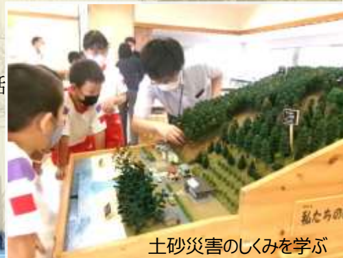
土砂災害のしくみを学ぶ

学校教育の場でも、人々が安心して暮らせる社会づくりを目指し、防災につながる学びを積み重ねています。小学校では4学年の社会科において自然災害から人々を守る活動について学んでいます。5学年の社会科でも自然条件などに関連して自然災害が発生することや、理科の学習において「流れる水のはたらき」という単元で土砂災害について扱うなど、学年ごとに多面的な視点で自然災害を題材にした学習を行っています。今年度の4年生は、島根県砂防課、奥出雲町総務課、奥出雲町社会福祉協議会の職員の方に来ていただき、それぞれの役割や、相互の連携を学びました。さらに勉強してきたことを踏まえて、「自助」として災害に備えて自分たちができることを話し合いました。将来、子どもたちはどこでどのような災害に直面するのか分かりません。どこで生活していてもいざというときに、防災についての学びを生かし、自分の命や周りの人の命を助けることができる防災の力をつけていきたいと思います。