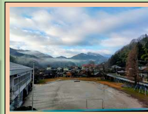
スキー教室は2月2日に延期しました。雪が降ることを子どもたちは願っています。