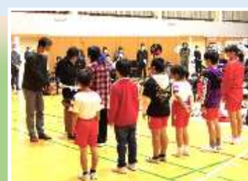
PTA 広報部 生活川柳の表彰式