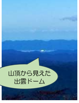
山頂から見えた 出雲ドーム