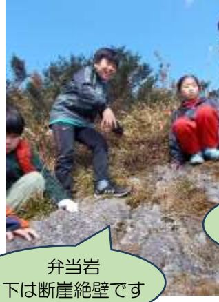
弁当岩 下は断崖絶壁です