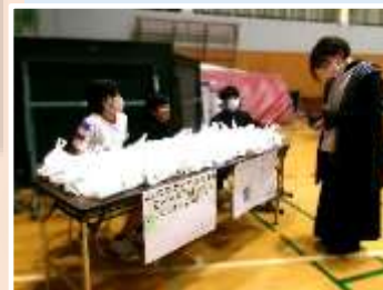
5・6年生が地域の皆様のご協力により作ったお米コーナー