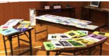
文集たいのす 創刊から52号