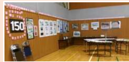
阿井小 150 いま むかし