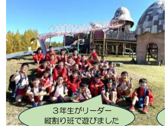
3年生がリーダー 縦割り班で遊びました