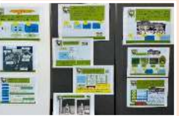
阿井小の歴史クイズ