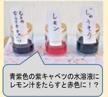
青紫色の紫キャベツの水溶液にレモン汁をたらすと赤色に!?

青空が広がる最高の天気となった4月9日、入学式を挙行了しました。10名の新入生は少し緊張気味ではありましたが、呼名の声も元気よく、晴れやかな表情で式に臨んでいました。校長からは、水溶液の実験を例示しながら、勉強の核となる「考えること」や好奇心・意欲につながる「わくわく・ドキドキ」を大事にすることを伝えました。2年生以上の子どもたちは、呼びかけや歌を通して新入生の入学を歓迎する気持ちを伝えていきました。6年間の小学校生活を通して、自分の中にある可能性を磨き、大きく成長していく姿を楽しみにしたいと思います。