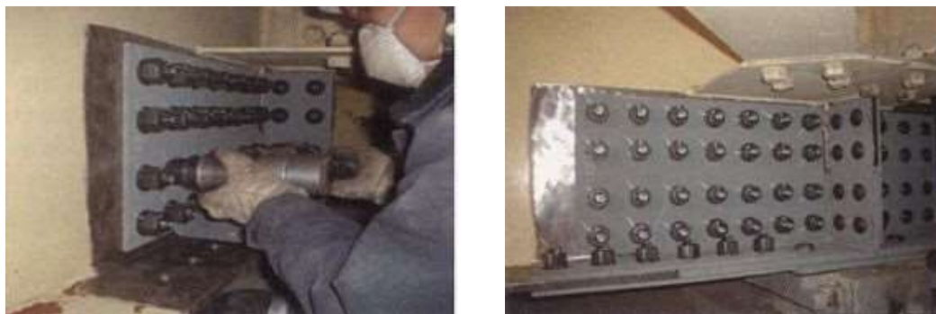
写真4-1 当て板工実施状況

激しい腐食による鋼部材の減厚が生じた箇所に対し、腐食箇所を取り囲むように当て板（添接版）を施すことにより鋼部材を補修する工法である。