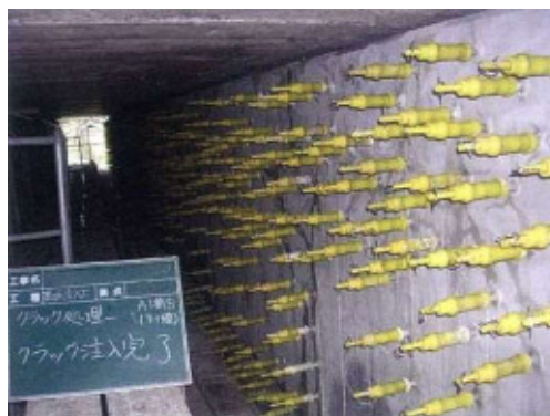
写真4-2 ひび割れ注入状況

ひび割れを塞ぐことにより、劣化因子（水分、塩化物など）の侵入を防止し、コンクリートの耐久性を向上することができる。