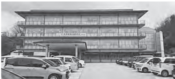
4月1日付で組織変更、奥出雲町

町長 深刻に考えるべき課題と認識している。ワークライフバランスや働きがいのある職場環境づくりなど、先進自治体の取組みも参考にし、人材戦略・人事