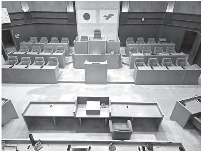
災害時の連携対応制を

質問 奥出雲町の「災害対応計画」では、災害時における議会との連携対応については記載されていない。災害時における議会との対応についての町長見解は。