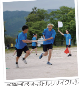
新種目「ペットボトルリサイクル」に挑戦