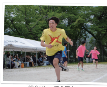
総合リレーで全速力! 優勝した黄組の3年生が疾走