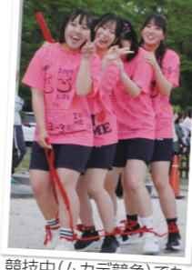
競技中(ムカデ競争)でも余裕のスマイル