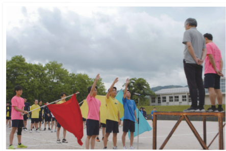
雨雲にも風にも負けない団長たちの決意表明

8月の文化祭は初日の28日を横田コミュニティセンター、2日目の29日を横田高校で開催予定です。奥出雲町のみなさまもぜひお越しください。