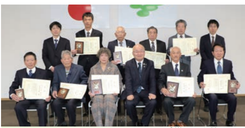
受賞された皆さん