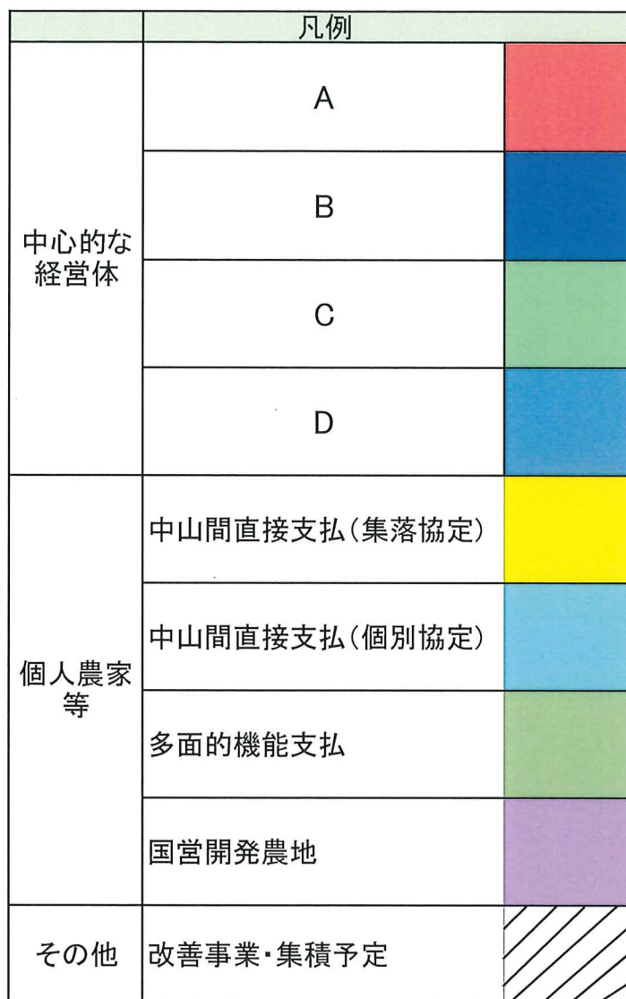
布勢地区 農業を担う者 対応表