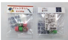
安来節演芸館 金太郎あめ