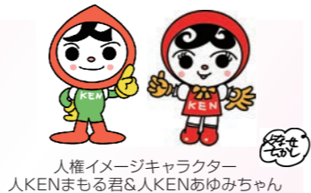
人権イメージキャラクター 人KENまもる君&人KENあゆみちゃん

この人権擁護委員の制度は、昭和24年6月1日に人権擁護委員法が施行されたことにより誕生しました。そこで全国人権擁護委員連合会では、毎年 6月1日 を「人権擁護委員の日」と定め、人権尊重の大切さを呼びかける日として特設人権相談所の開設や啓発活動に取り組んでいます。