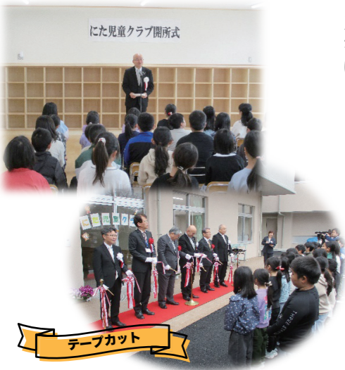
にた児童クラブ玄関前(仁多小学校内)

利用登録児童は、158名となり、新しい場所で支援員や仲間と一緒に生活していきます。放課後児童クラブは、保護者の就労等により学校から帰宅後、家庭に保護者がいない小学生に遊びや生活の場所を提供するところです。利用の際は事前登録が必要です。詳しくはご自宅家庭支援課（54-2504）までお問い合わせください。