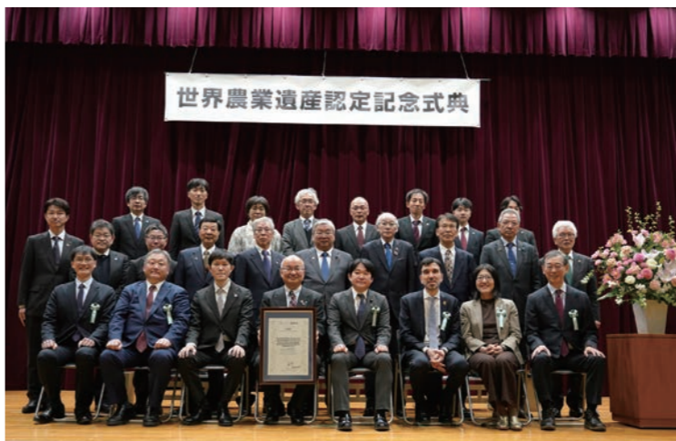
▲認定式典に参加した奥出雲地域の皆さん

2月5日、世界農業遺産認定記念式典が農林水産省(東京)において開催され、奥出雲町農業遺産推進協議会から18名が出席し、会場に約100名が集まりました。世界農業遺産の認定地域は日本国内で17地域、昨年10月に国連食糧農業機関(FAO)本部で日本から新たに4地域に認定証が授与され、この度、政府主催の認定記念式典が開催されました。