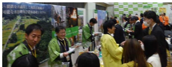
▲奥出雲町の特産品をPRする特設ブースの様子

今回、世界農業遺産認定の喜びを共有し、各認定地域の特徴や取組について理解を深めることができ、世界に認められた農業遺産を自信や誇りにして、今後の取組やこれからの展望を考える貴重な機会となりました。