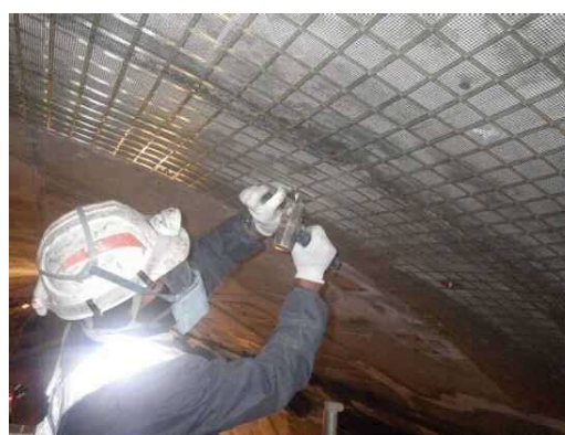
写真 3-1 FRP ネット設置状況