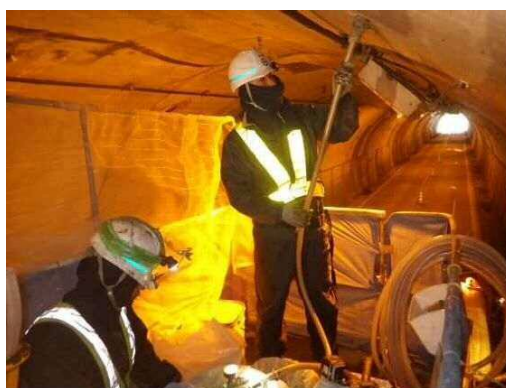
写真 3-4 裏込注入状況