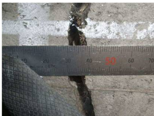
覆工（アーチ）のひび割れ