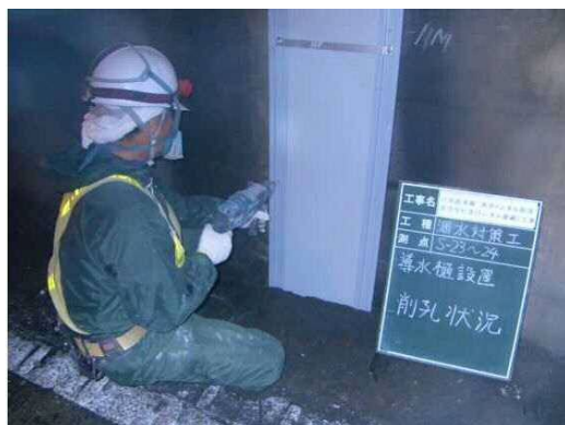
写真 3-2 線導水工