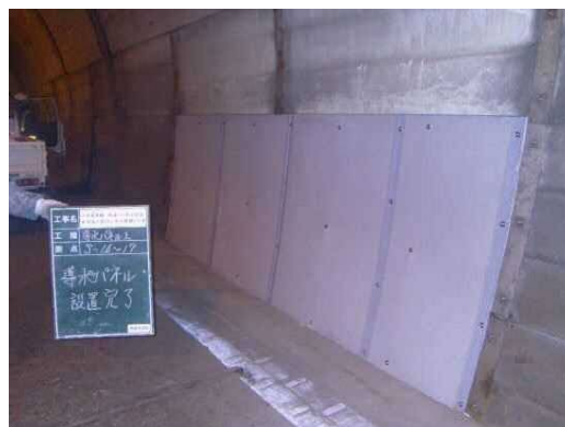
写真 3-3 面導水工