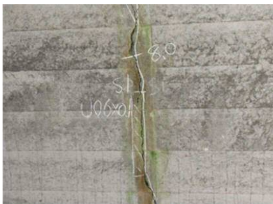
覆工（アーチ）のうき