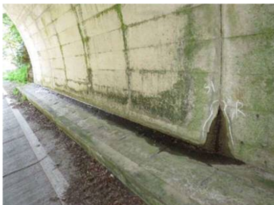
覆工（側壁）からの漏水