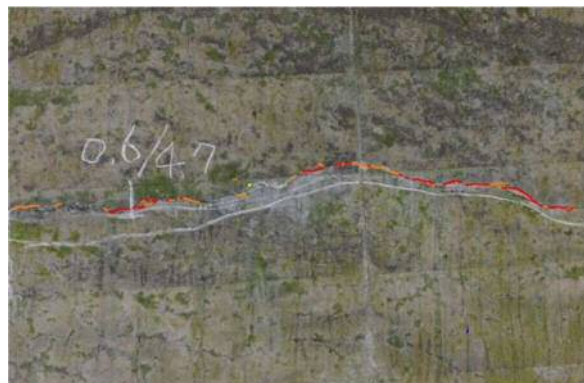
写真4-2 AI ひび割れ解析