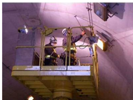
写真2-1 トンネル点検状況