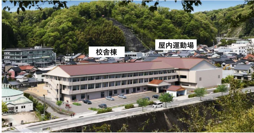
新校舎外観イメージ