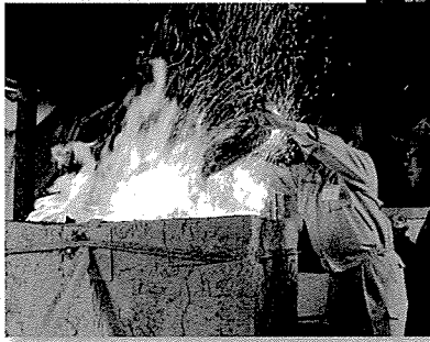
参加者による砂鉄・木炭装入